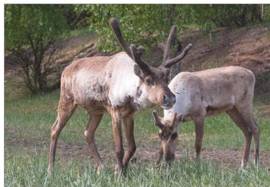
Лесные северные олени в вольере в п. Рустай

После взятия анализов крови и одевания ушных бирок животных погрузили в транспортировочные ящики и повезли в заповедник, где 13 марта оленей выпустили в передержку адаптационного вольера. Олененок быстро освоился и уже на следующий день спокойно ел в присутствии самцов. Затем и оленуха стала посещать кормушку – пробовала веники и сухие кор-