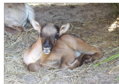
Новорожденный олененок, май 2019 г.