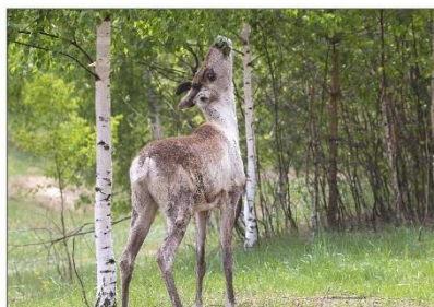
Годовалый олененок Чуб