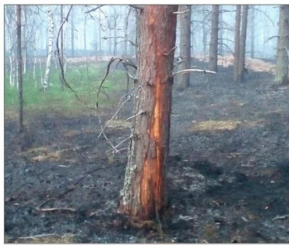
Сосна, пораженная молнией 10 июня