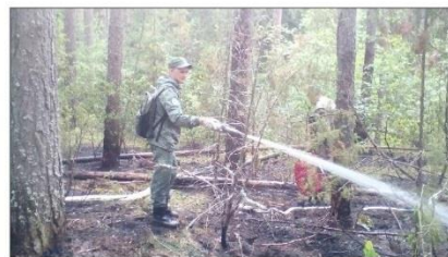
Тушение лесного пожара

Для тушения огня от ближайшего водоема была проложена магистраль протяженностью 1 км, по которой с помощью прицепной мотопомпы подавалась вода. В ликвидации пожара принимало участие 9 госинспекторов, были задействованы трактор с плугом, автоцистерна, машина повышенной проходимости «Садко», малый лесопатрульный комплекс, 2 мотопомпы.