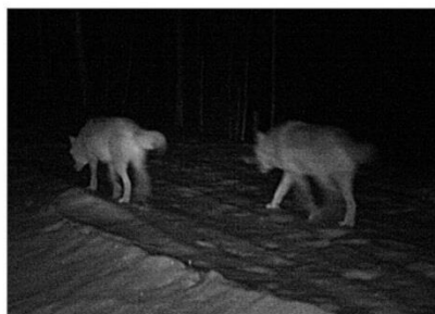
Волки (кадр с фотоловушки)

Анализ регистраций следов волков и самих зверей фотоловушка-